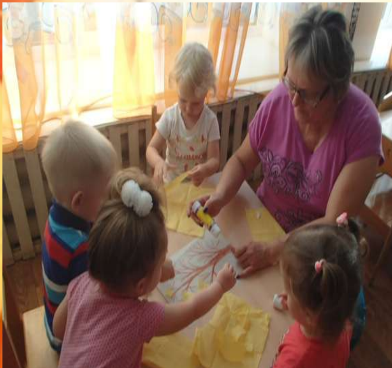
Аппликация из салфеток