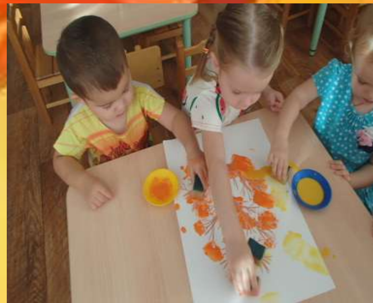
Рисование поролоновыми губками и ладошками