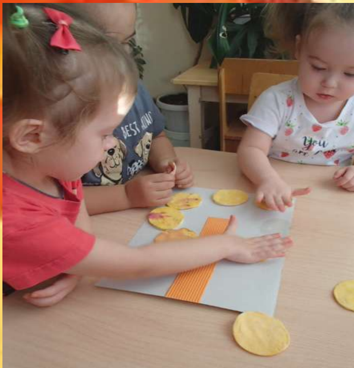
Аппликация из ватных дисков