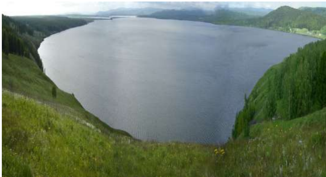
Самое большое из них — озеро Большой Берчикуль.

Соседями Кемеровской области являются: с севера — Томская область, с востока — Красноярский край и Республика Хакасия, с юга — Республика Алтай, с юго-запада — Алтайский край и с запада — Новосибирская область.