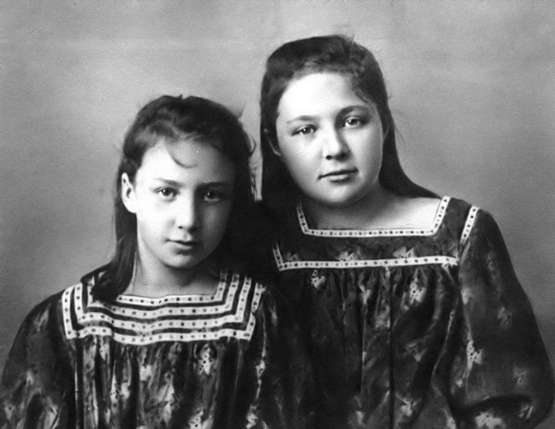
Анастасия и Марина Цветаевы.