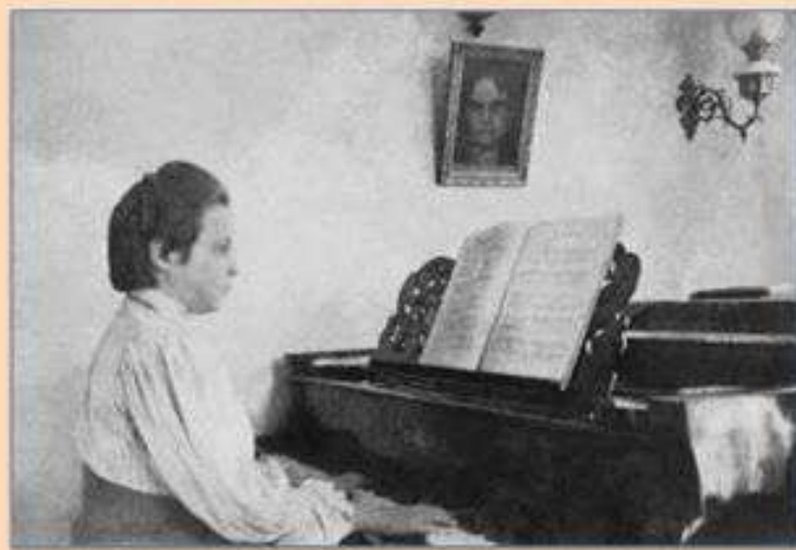
М. Цветаева за роялем в доме Цветаевых в Москве