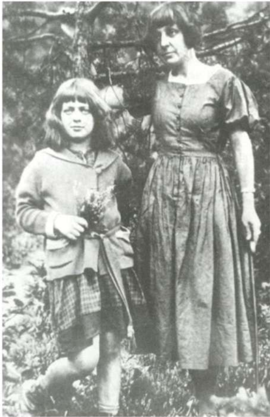
Марина Цветаева с дочерью Ариадной