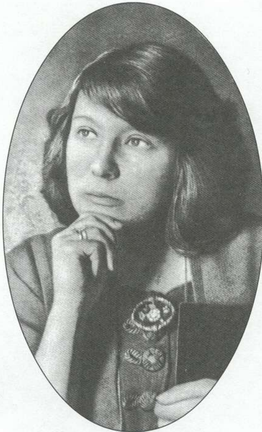
Марина Цветаева. 1912 г.