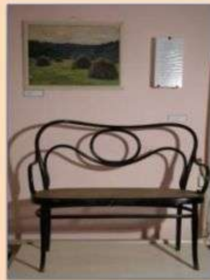
Дачный диванчик из дома Цветаевых в Москве