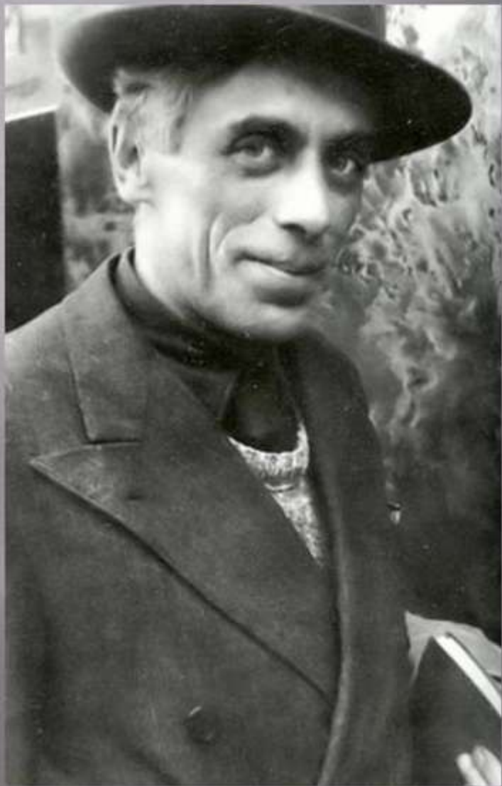
Фото 1937г. Франция

Происходил из семьи революционеров-народников. Рано остался сиротой. Участник белого движения, вынужден был эмигрировать через Константинополь в Прагу, затем переехал во Францию. В 1937 г. приехал в СССР. В 1939 г. был репрессирован и расстрелян 8 августа 1941г.