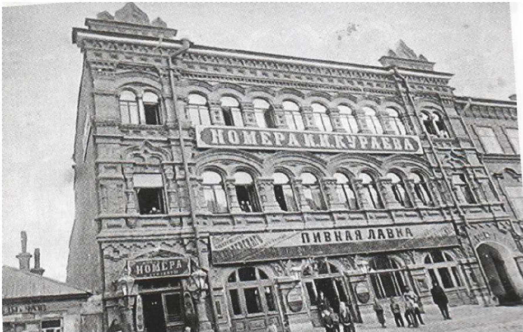
Таким был дом, где жила М. И. Цветаева в 1911 году.