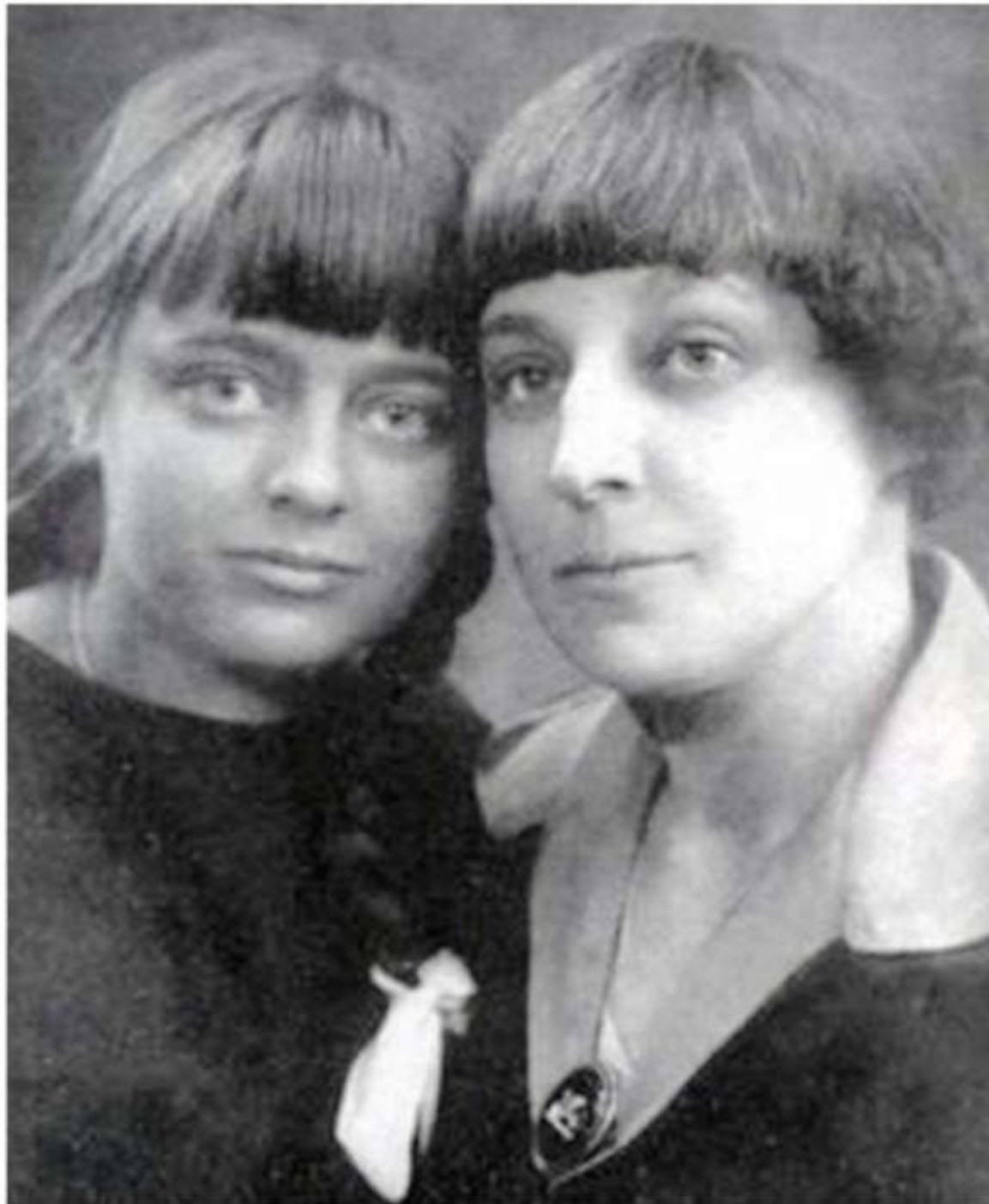
Ариадна Эфрон с Мариной Цветаевой