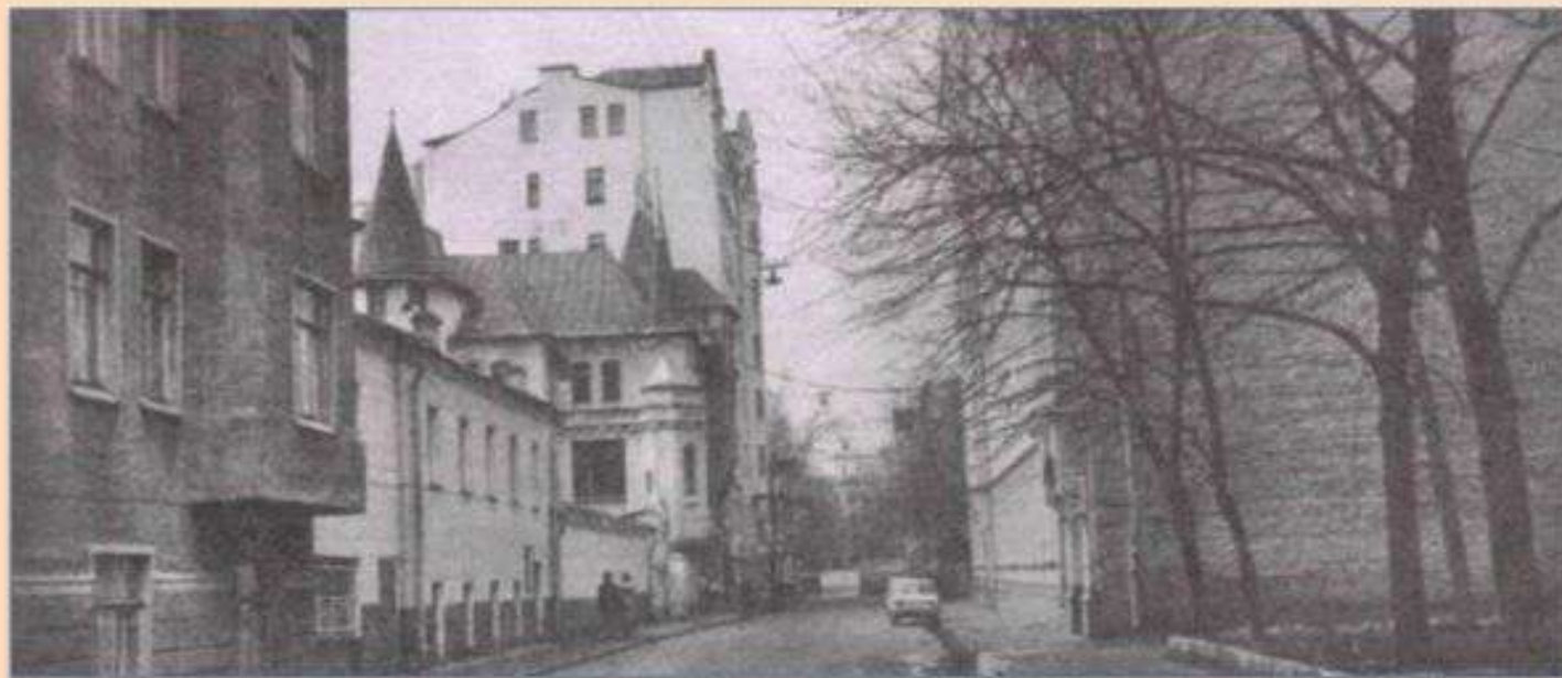
Трехпрудный переулок в Москве