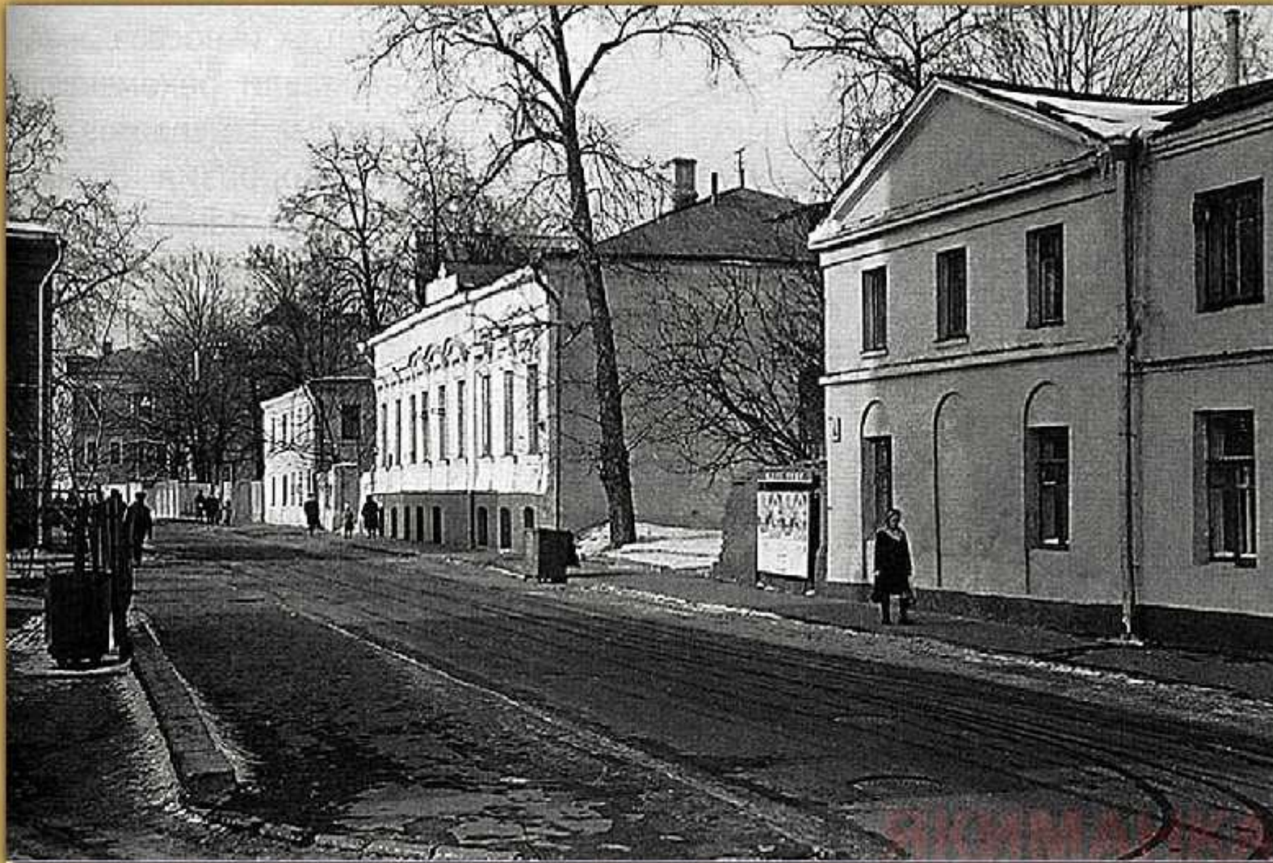
Трехпрудный переулок в Москве