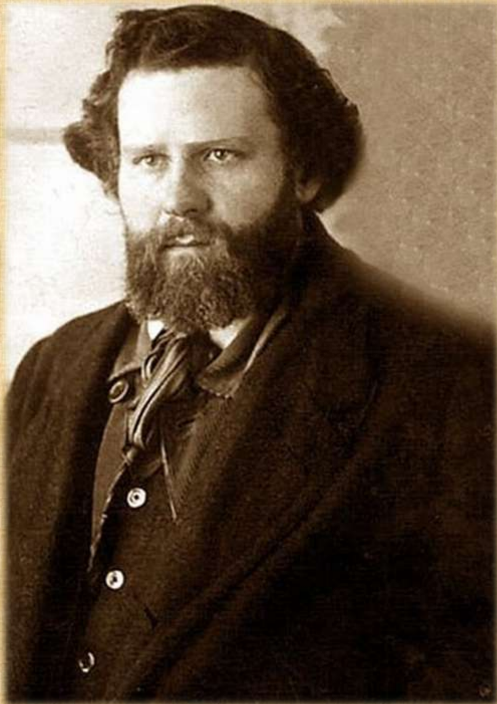
Поэт и художник Максимилиан Волошин