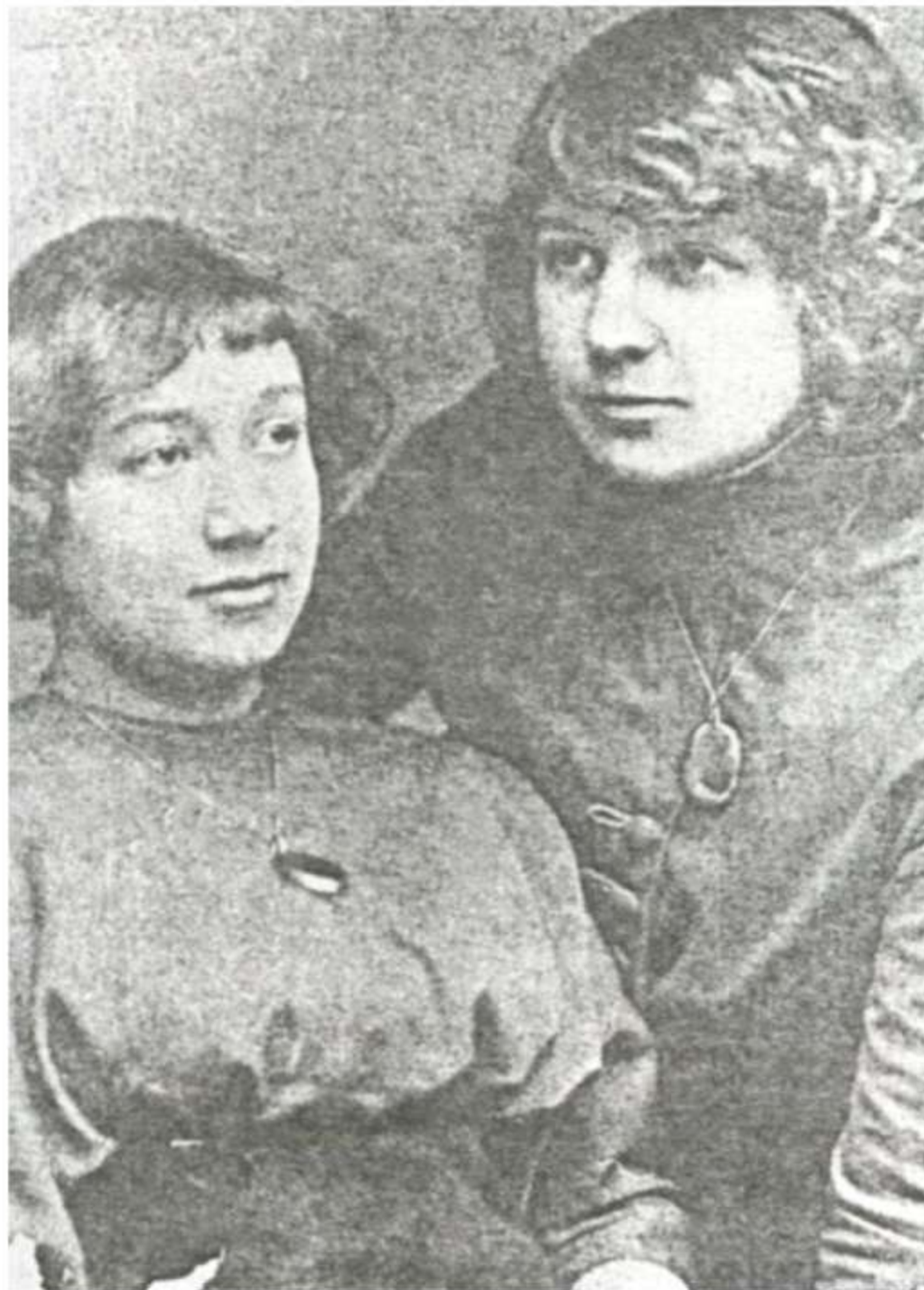
Анастасия и Марина Цветаева. 1911 год.