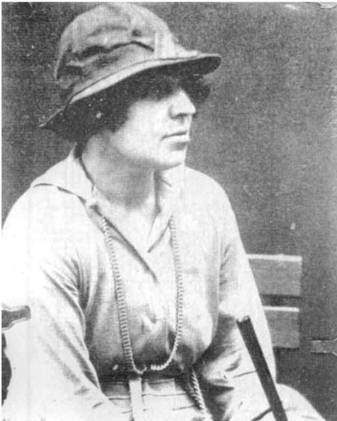
Марина Цветаева в эмиграции. 1922г., Земгора