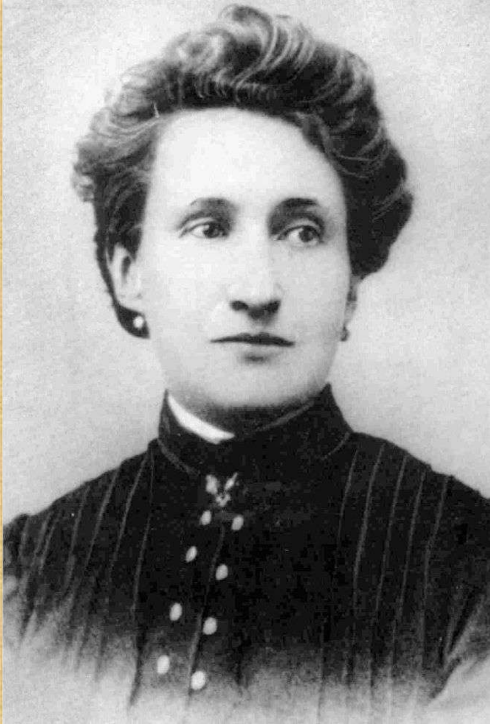
Мария Александровна Мейн - мать М.Цветаевой