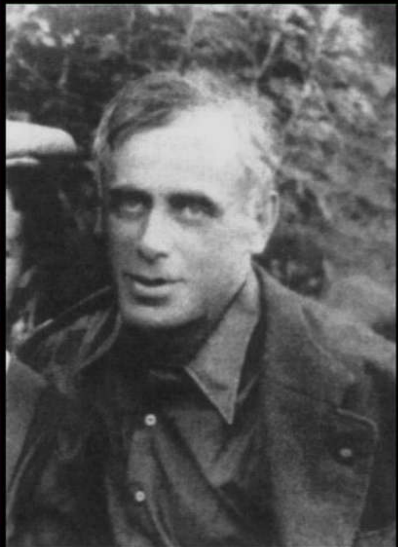
Сергей Эфрон (1893-1941)