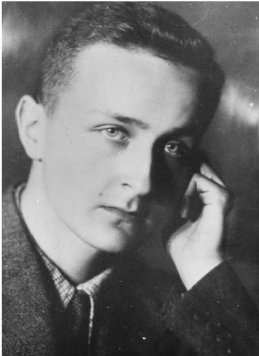
Георгий Эфрон – сын Марины Цветаевой