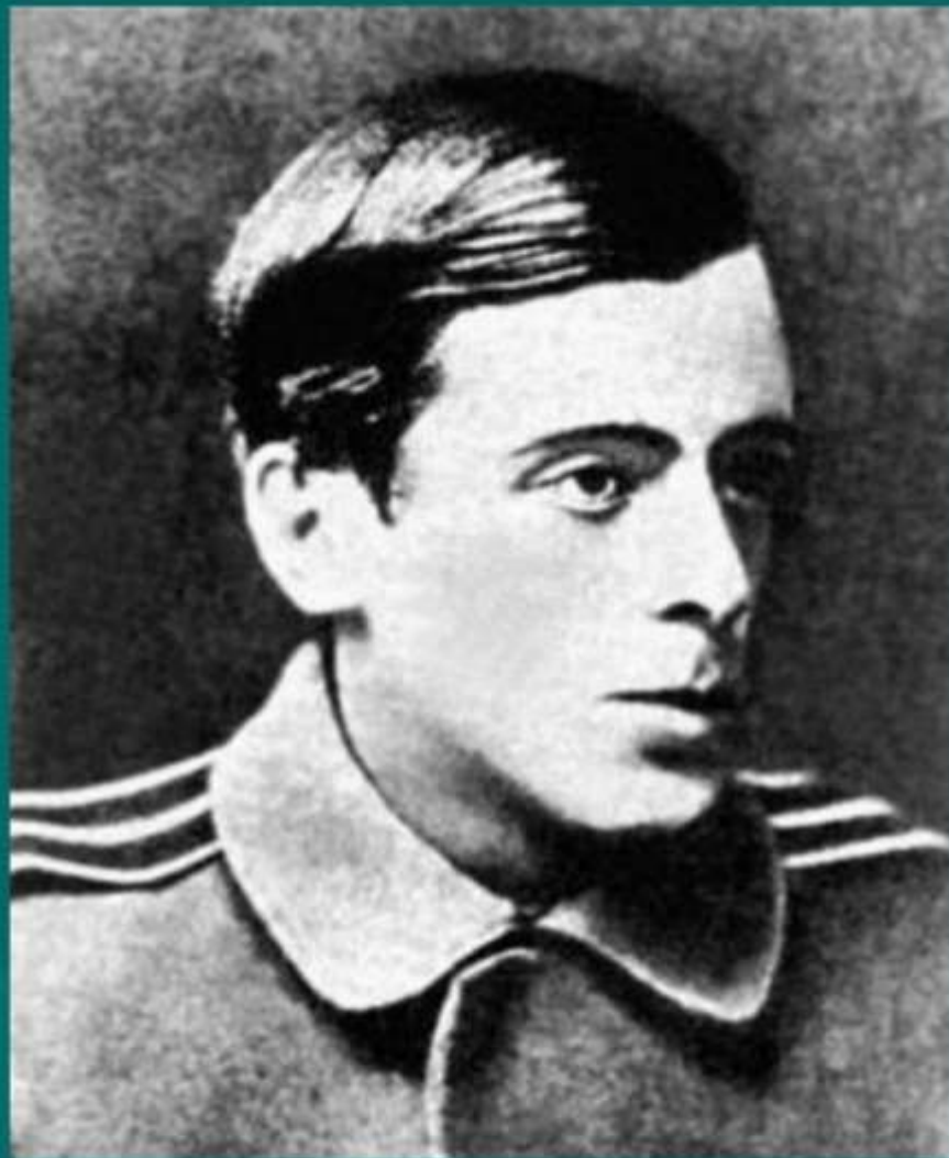
Сергей Эфрон муж М.И.Цветаевой (с 1912), участник Первой мировой войны и Белого движения.